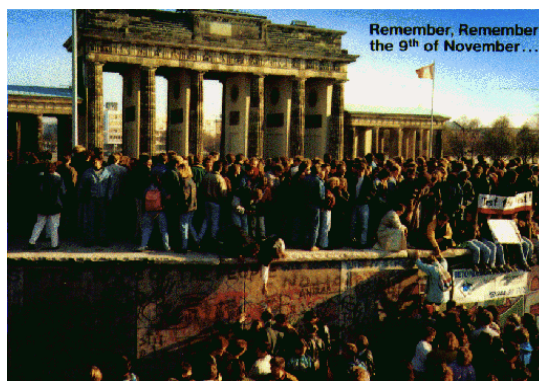
9 Νοεμβρίου 1989, άνοιξαν οι πύλες του Βερολίνου- Ben Walsh-modern World History-GCSE

Χιλιάδες άνθρωποι, εγκατέλειπαν μέρα με τη μέρα την Ανατολική Γερμανία και περνούσαν στην άλλη πλευρά του τείχους. Αυτό προκάλεσε σύγχυση στην κυβέρνηση του Ανατολικού Βερολίνου κι έτσι οργανώθηκε μια σύσκεψη με σκοπό την εύρεση λύσεων για αυτό το θέμα. Ο Γκύντερ Σαμπόβσκι που ήταν ο τρίτος γραμματέας του κομμουνιστικού κόμματος στο Ανατολικό Βερολίνο, έδωσε στις 9 Νοεμβρίου 1989 μια συνέντευξη τύπου σε ξένους ανταποκριτές. Κάποια στιγμή αναφέρει ότι η απόφαση που πάρθηκε στο συμβούλιο ήταν μια αλλαγή διατάξεων περί ταξιδιών προς το εξωτερικό. Είπε: «...κατάρριψη των περιορισμών...ελεύθερη διακίνηση...». Τότε τον ρωτά ένας Ιταλός δημοσιογράφος «από πότε θα ισχύει αυτό;» και η απάντηση που πήρε ήταν «από όσο ξέρω...από τώρα, αμέσως». Η ατμόσφαιρα εκείνη τη στιγμή ξαφνικά ηλεκτρίστηκε. Οι δημοσιογράφοι