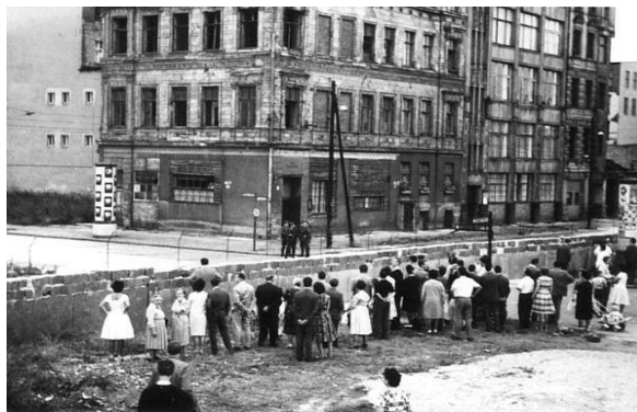
Βερολίνο 1961, τείχος του Βερολίνου στην οδό Zimmerstrasse/Markgrafenstrasse

Μετά από την ανέγερση του τείχους η δυτική πλευρά ακολουθούσε το δυτικό τρόπο ζωής, επικρατούσε ο καπιταλισμός και το ισχύον πολίτευμα ήταν η δημοκρατία. Στη Ανατολική Γερμανία το ισχύον πολίτευμα ήταν ο Κομμουνισμός. Ο σημαντικότερος κλάδος την οικονομίας της Ανατολικής Γερμανίας ήταν βιομηχανία με κατασκευή μηχανημάτων παραγωγής, αυτοκινήτων και τρένων. Όλες οι μεγάλες εταιρίες είχαν κρατικοποιηθεί και οι αγρότες ήταν συνήθως οργανωμένοι σε οργανισμούς. Μετά το στήσιμο του τείχους οι εμπορικές επαφές με την Δυτική Γερμανία διακόπηκαν. Σε σύγκριση με άλλες ανατολικές χώρες ήταν πιο ελεύθερη και εξελιγμένη. Το κέντρο του Ανατολικού Βερολίνου, χωρίς να διαθέτει το πλούτο της Δύσης, δεν έδινε την εντύπωση της φτώχειας. Ωστόσο η αποτυχία του σοσιαλιστικού σχεδιασμού προκάλεσε κρίση, η οποία οδήγησε στη κατάρρευση του συστήματος. Ταυτόχρονα υπήρχε γραφειοκρατία, τεχνολογικό χάσμα με τη Δύση που προκαλούσε χρόνια έλλειψη καταναλωτικών αγαθών και απαρχαιωμένες υποδομές. Στα θετικά συμπεριλαμβάνονται τα χαμηλά ενοίκια, η δωρεάν υγειονομική περίθαλψη και η γενναιόδωρες άδειες μητρότητας και υποτροφιών.